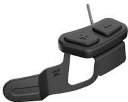
10U for Shoei® GT-Air